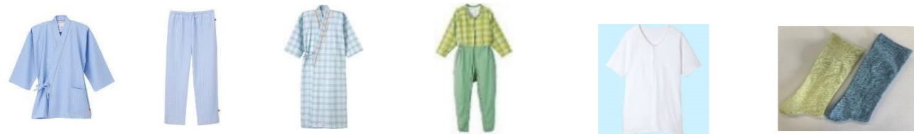
病衣（甚平タイプ・浴衣タイプ）