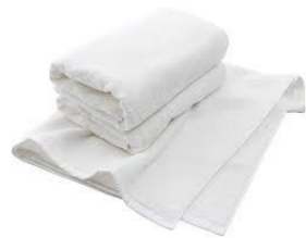
バスタオル・フェイスタオル